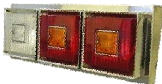
テールランプステー

BOXサイズ 239 × 635 × 63 バイザーサイズ 104.5 × 655 × 70